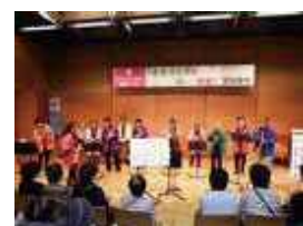
息・活・音 (イキ・イキ・ネ)