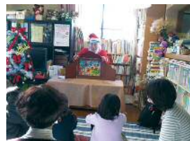
いぬくら子ども文庫