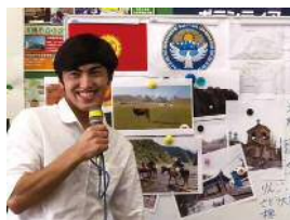
国際おしゃべりサロン宮前